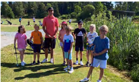
Kom och var med på golfskoj!

Nu börjar det dra ihop sig! Under sommaren 2022 planerar vi för en fartfylld och lärorik golfsommar för våra juniorer. Vi som är ansvariga hoppas att ni ser fram emot detta lika mycket som vi gör! – Men vad står på schemat?