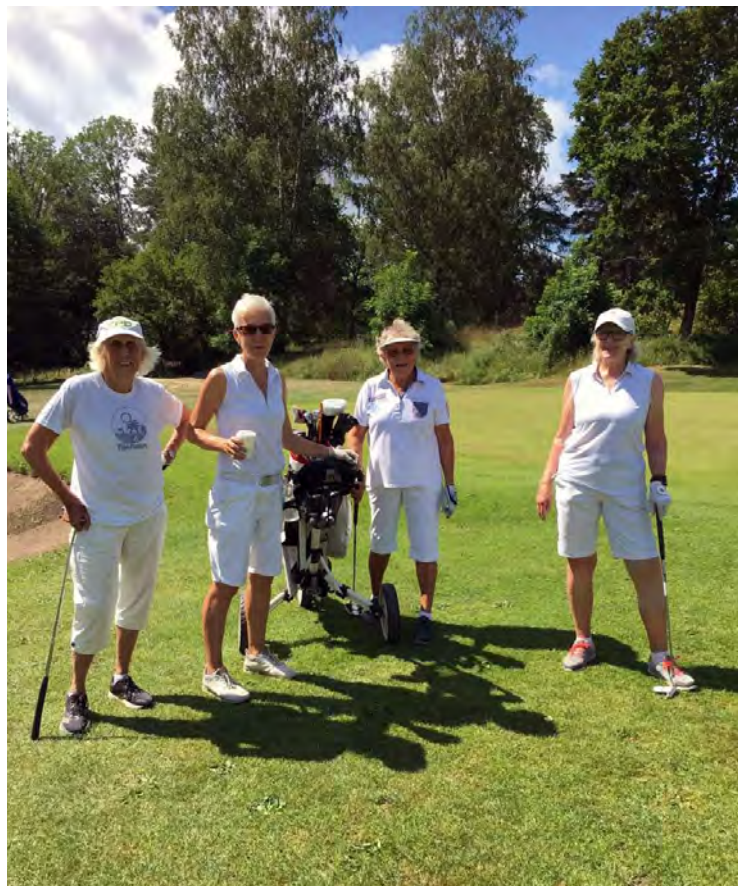
Ladies in white.