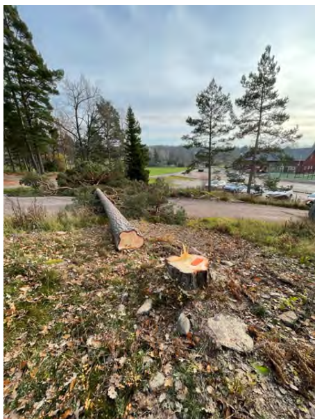
Röjning av hinder.

Nu när ännu en golfsäsong knackar på dörren ska det bli kul att åter få öppna upp Ljusterö Golf till årets spel. Det har nu gått ett år sen jag antog jobbet att driva och utveckla vår fina anläggning och då var det fortfarande Covid som dominerade debatten och höll oss i ett kollektivt grepp. Nu när vi inte har några restriktioner längre så är det i stället dom tragiska händelserna i Ukraina som påverkar oss på flera plan.