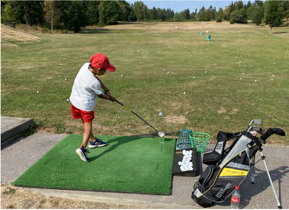
Övning ger färdighet.

Nu börjar det dra ihop sig! Under sommaren 2022 planerar vi för en fartfylld och lärorik golfsommar för våra juniorer. Vi som är ansvariga hoppas att ni ser fram emot detta lika mycket som vi gör! – Men vad står på schemat?