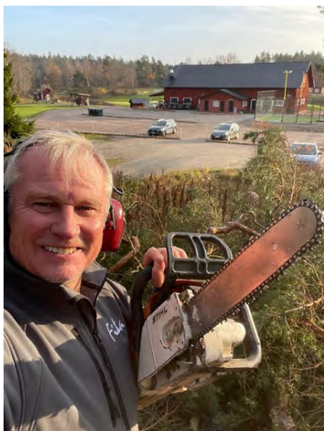
VD in action.

Nu när ännu en golfsäsong knackar på dörren ska det bli kul att åter få öppna upp Ljusterö Golf till årets spel. Det har nu gått ett år sen jag antog jobbet att driva och utveckla vår fina anläggning och då var det fortfarande Covid som dominerade debatten och höll oss i ett kollektivt grepp. Nu när vi inte har några restriktioner längre så är det i stället dom tragiska händelserna i Ukraina som påverkar oss på flera plan.