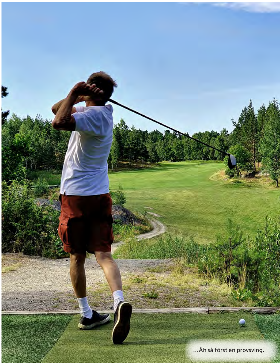
...Åh så först en provsving.

Klubben har i över 20 år haft lag med i Stockholmsdistriktets seriespel mellan länets alla golfklubbar. Från början var det endast något enstaka lag men för drygt 15 år sedan tog det bättre fart. Ljusterö hade då ett gäng väldigt duktiga 18–25-åringar som lyckades bra i seniorklassen och deltog till och med några säsonger i Svenska golfförbundets allsvenska spel som spelas likt Ryder Cup med foursomespel och singlar över flera dagar.