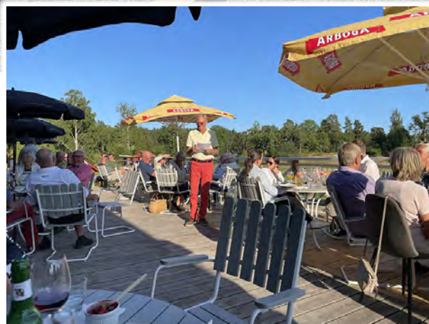
...med efterföljande prisutdelning.

I fyra ämnen får du klara olika uppgifter och introduceras till det viktigaste du behöver veta för att börja spela golf. Du kan genomföra uppgifterna när du vill och i vilken takt du vill. Dina framsteg sparas automatiskt.