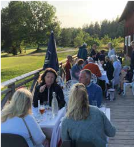
Belöning på 19:e hålet.

Vi är många på klubben som kommer ihåg charmen med bondens kacklande höns i vårt klubbhus. Ja, många av oss var med redan då för över 25 år sedan. Vi var glada över vårt speciella klubbhus och vår nyöppnade bana med 6 hål.