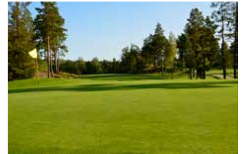
7-köret för morgonpigga.

7-köret är en tävling för alla som älskar golf, naturupplevelser, och ljuvliga sommar-morgnar.