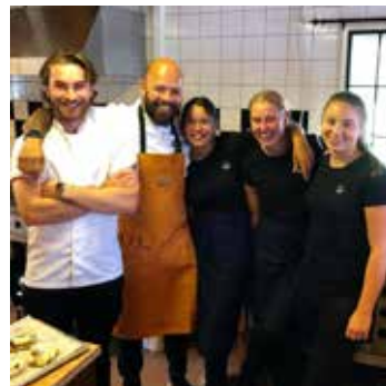
Räkna med temakvällar och grillaftnar i år också.