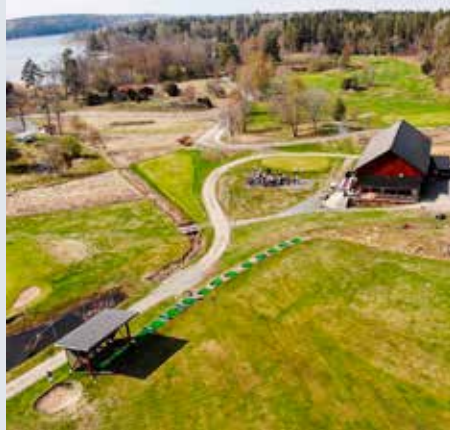
Alltid med medlemmarna i fokus.

För övrigt är det ett möte som jag verkligen ser fram emot – ett slags ”formell” uppstart på säsongen – fast lite senare än vanligt!